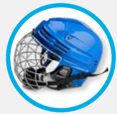
冰球/滑冰/雪橇头盔